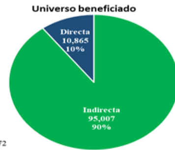
Población directa asistiendo a actividades en las clínicas

Se reprodujeron 40 ejemplares de un (1) manual interno institucional para la anticoncepción, que incluye la anticoncepción post-evento obstétrico en la adolescencia y está siendo usado dentro del protocolo de la atención de las clínicas. Se implementaron cinco procesos de capacitación sobre este tema, que alcanzó a 146 proveedores de servicios de salud y personal técnico.